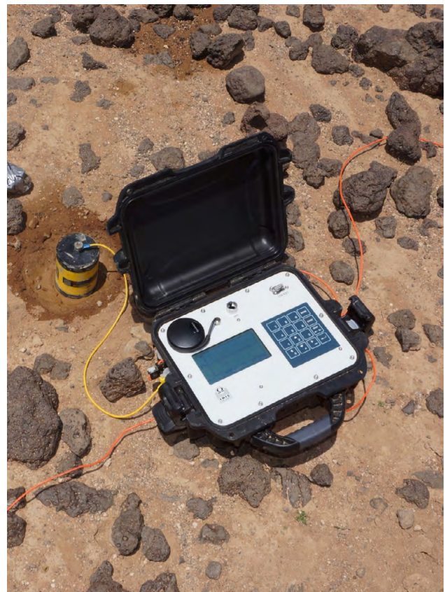
Électrode impolarisable reliée à un récepteur permettant des mesures de séries temporelles.

Comme le champ électrique induit est faible en comparaison du champ électrique primaire, il faut veiller à limiter les sources de bruit électrique autant que possible. Ainsi, il est recommandé d'utiliser des électrodes impolarisables.